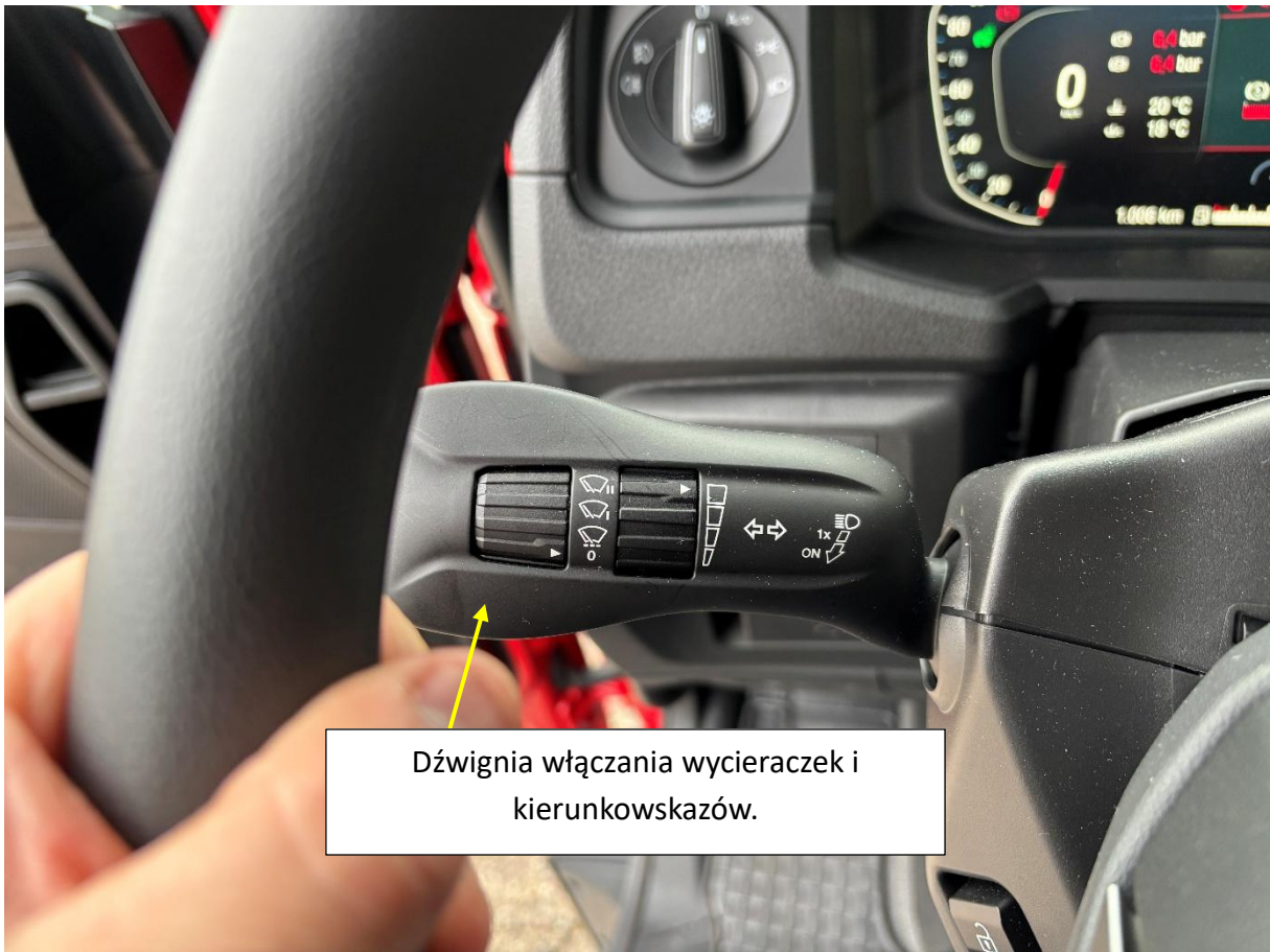
Dźwignia włączania wycieraczek i kierunkowskazów.