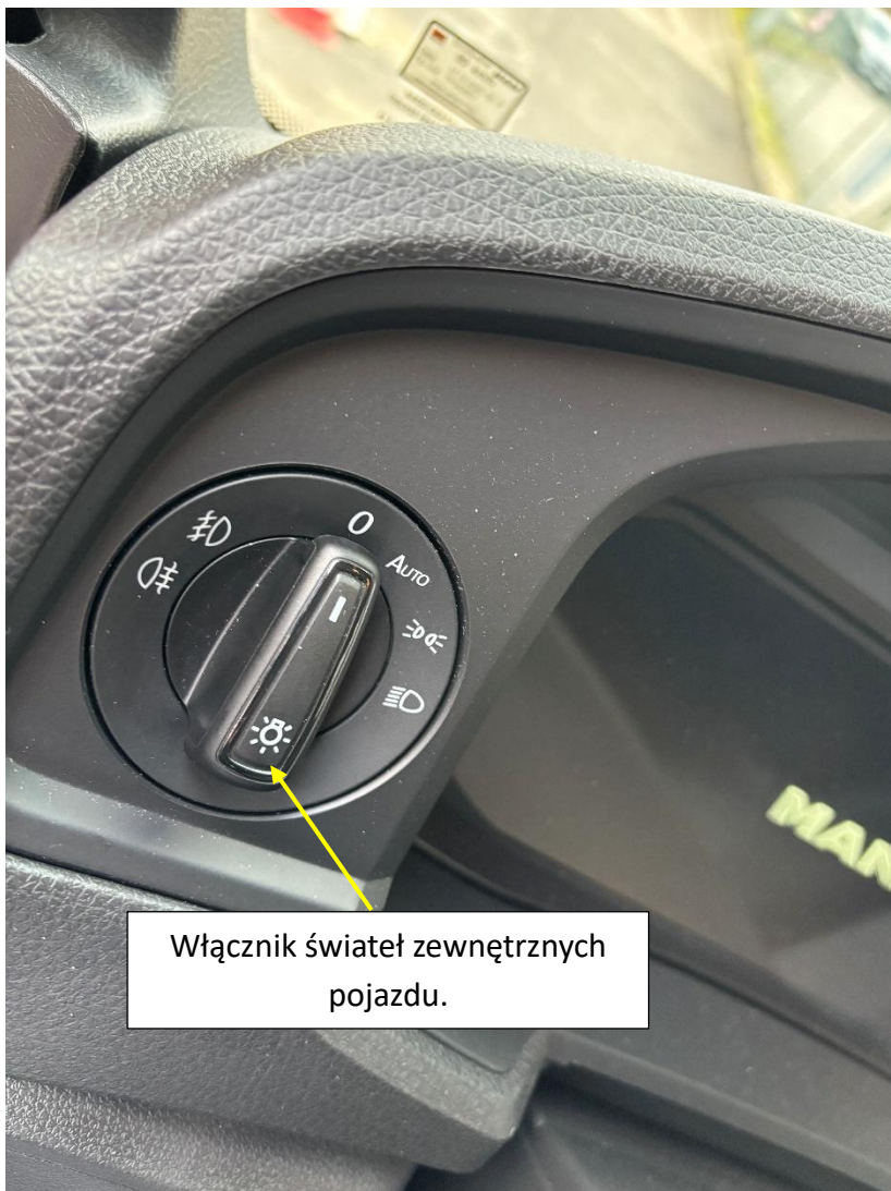
Włącznik świateł zewnętrznych pojazdu.