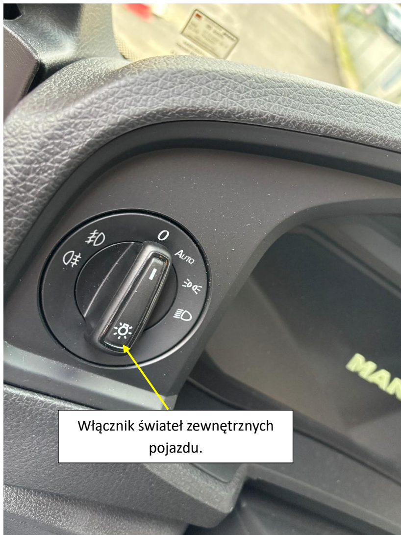
Włącznik świateł zewnętrznych pojazdu.